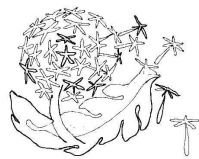
BIBLIOTECA COMUNALE RONCEGNO TERME