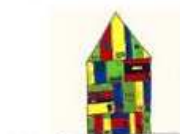
Biblioteca Pubblica Comunale di Borgo Valsugana (TRENTO)