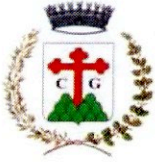
Comune di Grigno