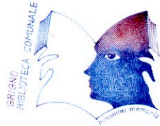
Biblioteca Comunale "O. Gasperini"