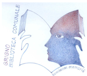
Biblioteca Pubblica Comunale "Orlando Gasperini" di Grigno