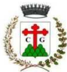
Assessorato alla Cultura di Grigno